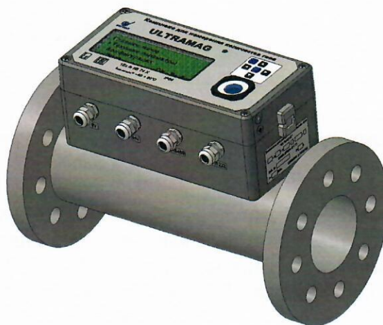
Рисунок 1 - Общий вид комплекса «ULTRAMAG»

Комплексы имеют 3 варианта исполнения по погрешности измерения рабочего расхода и следующие модификации в зависимости от верхней границы диапазона измерения рабочего расхода: G10, G16, G25, G40, G65, G100, G 160, G250.